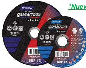
*Nueva imagen 2018